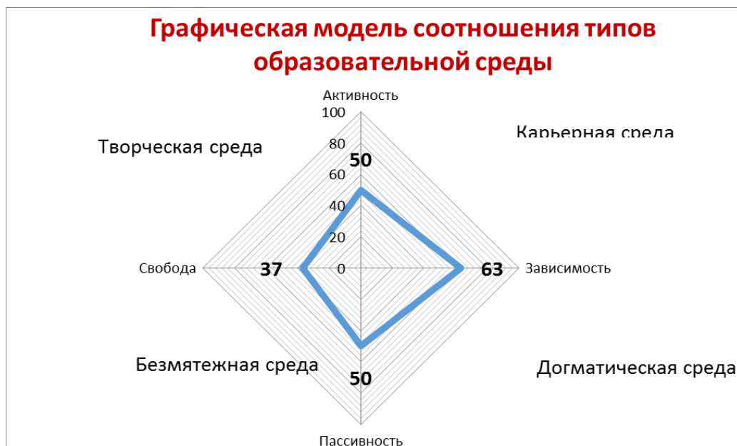
Рисунок 1. Графическая модель соотношения типов образовательной среды

В качестве респондентов по выявлению соотношения типов образовательной среды участвовал педагогический коллектив лицея и администрация.