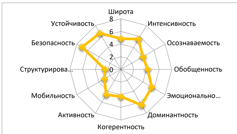
Рисунок 2. Результаты диагностики школьной среды на основе комплекса количественных параметров

Из полученных данных в результате экспертизы школьной среды можно сделать вывод, что наиболее низкие значения у таких показателей, как структурированность, мобильность, осознаваемость, когерентность.